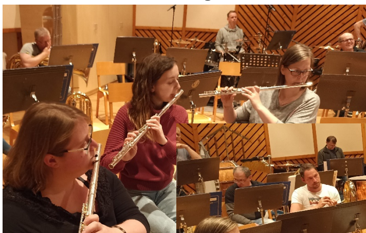
Die Reihen sind „ziemlich“ Leer.