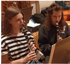
Die Klarinetten hatten diesmal keine Unterstützung.