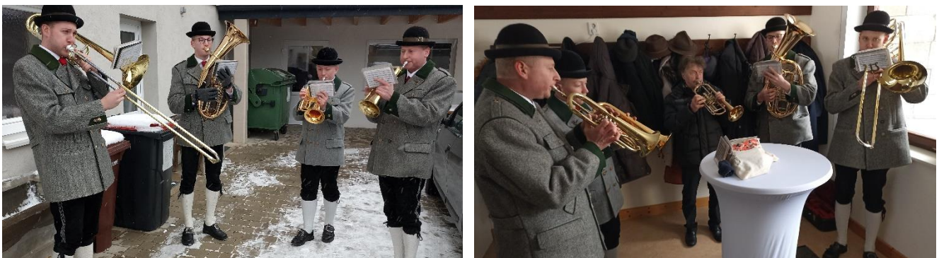
Zuerst spielte unser Quartett im Hof und als es zu kalt wurde spielten sie im Vorraum als Quintett.