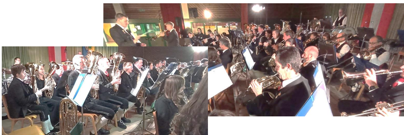
Nach dem Konzert spielten noch die 3 jungen Puchberger auf (Archivbild vom 24. Juni 2023)