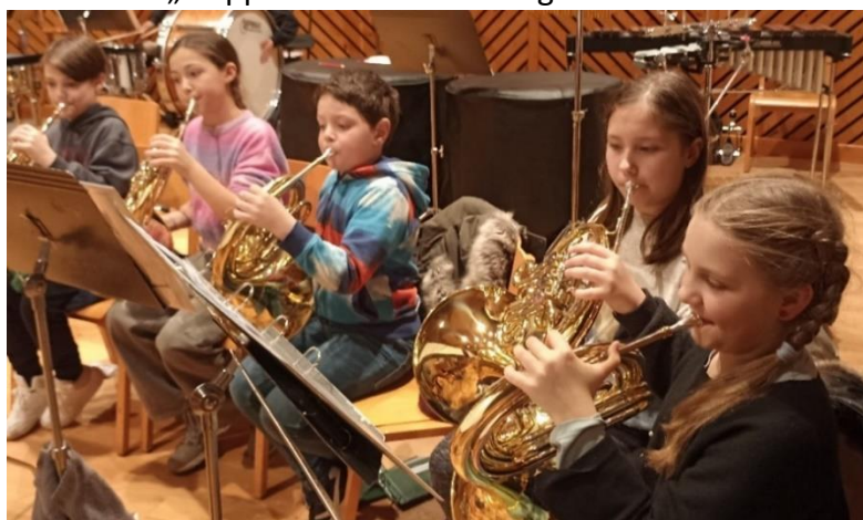
Die „Truppe“ von links hinten gesehen.