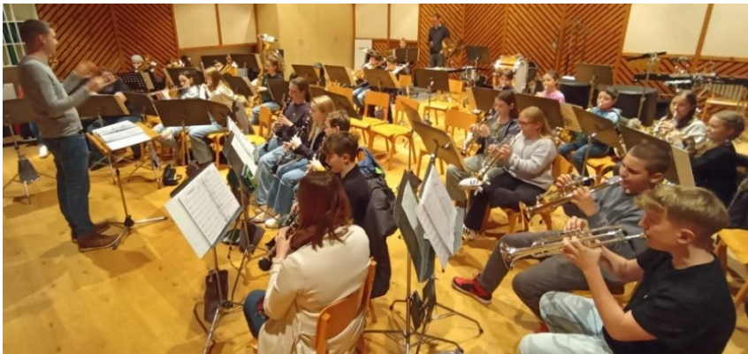
Zum Schluß ein Foto von Rechts Vorne und ein Abfragen des Wissens von unseren Jungmusikern (Frage: Wer weiß was bei ff zu tun ist?)