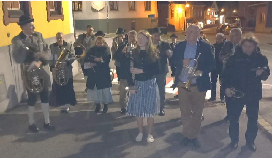
Vor dem Gasthaus zum Schwarzen Adler.