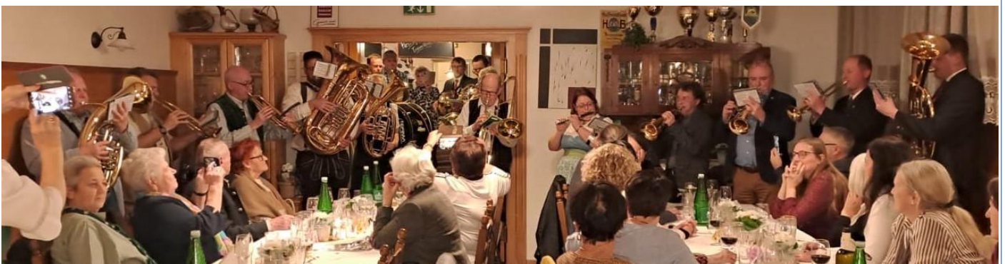
Danach marschierten wir im Gänsemarsch zum „Festsaal“.